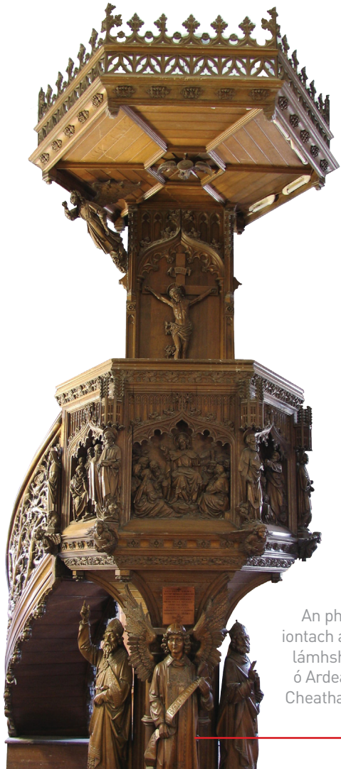
An phuilpid iontach álainn lámhshnoite ó Ardeaglais Cheatharlach